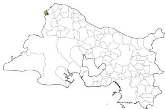
Localisation de la commune dans le département des Bouches-du-Rhône