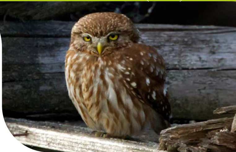
Chevêche d'Athéna © André SIMON