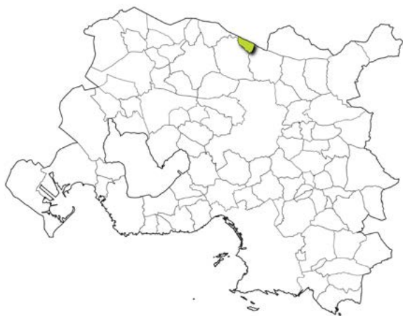
Localisation de la commune dans la métropole d'Aix-Marseille-Provence