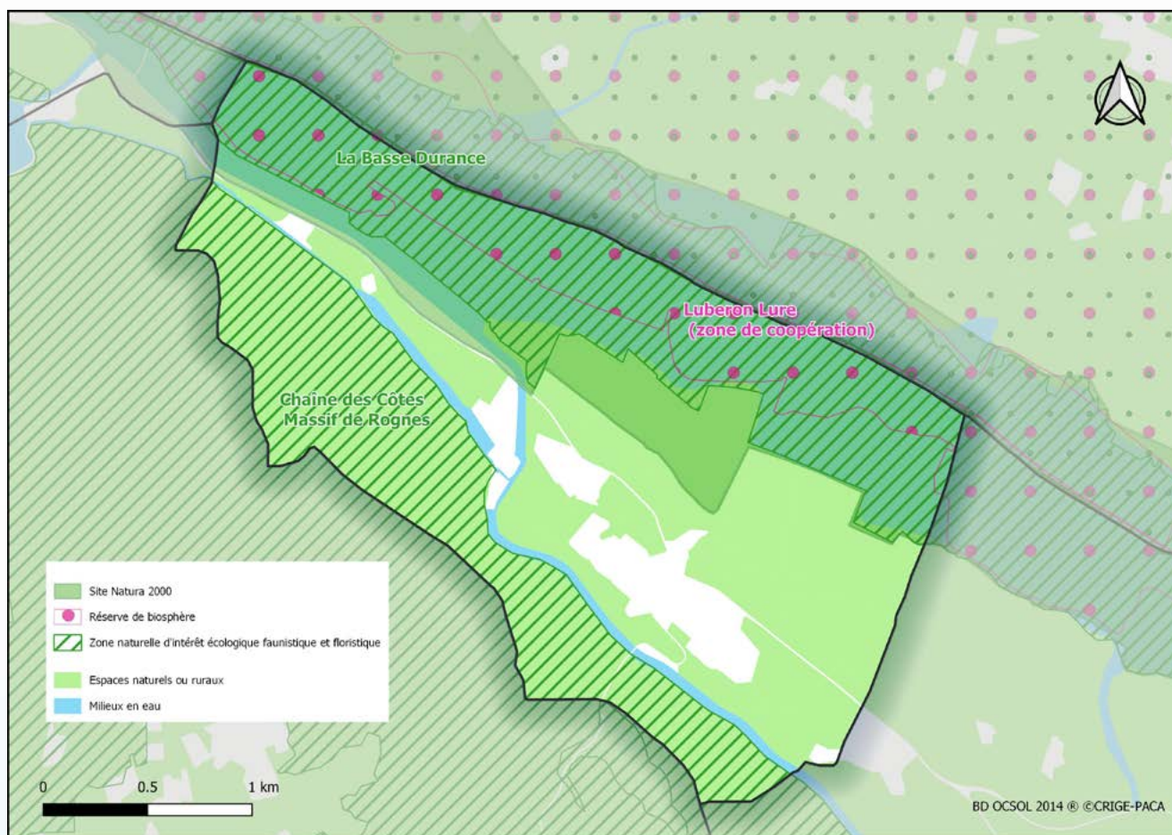
Carte 1 : Cartographie des espaces naturels de Saint-Estève-Janson

D'une surface de 7 km 2 , 92% de la commune de Saint-Estève-Janson sont des espaces naturels et ruraux. 64% sont identifiés par des zonages à enjeu écologique.