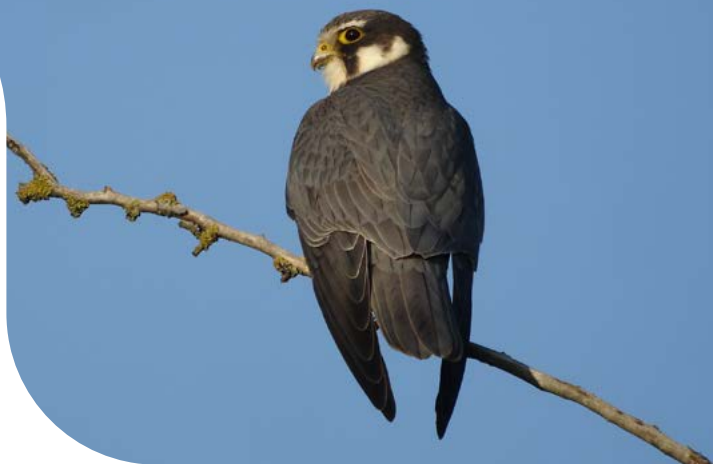
Faucon hobereau © Christian AUSSAGUEL