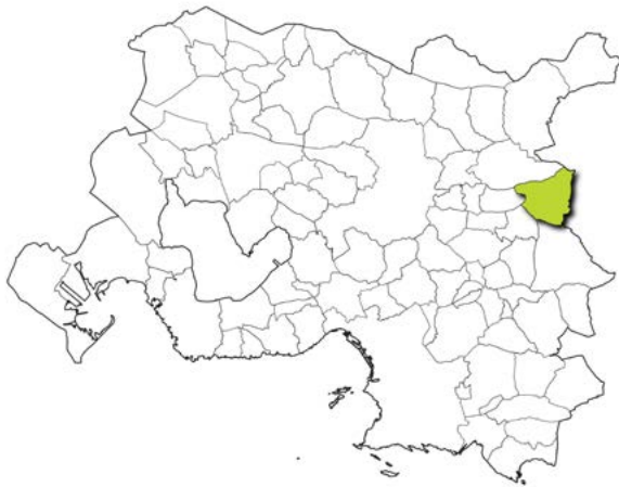
Localisation de la commune dans la métropole d'Aix-Marseille-Provence