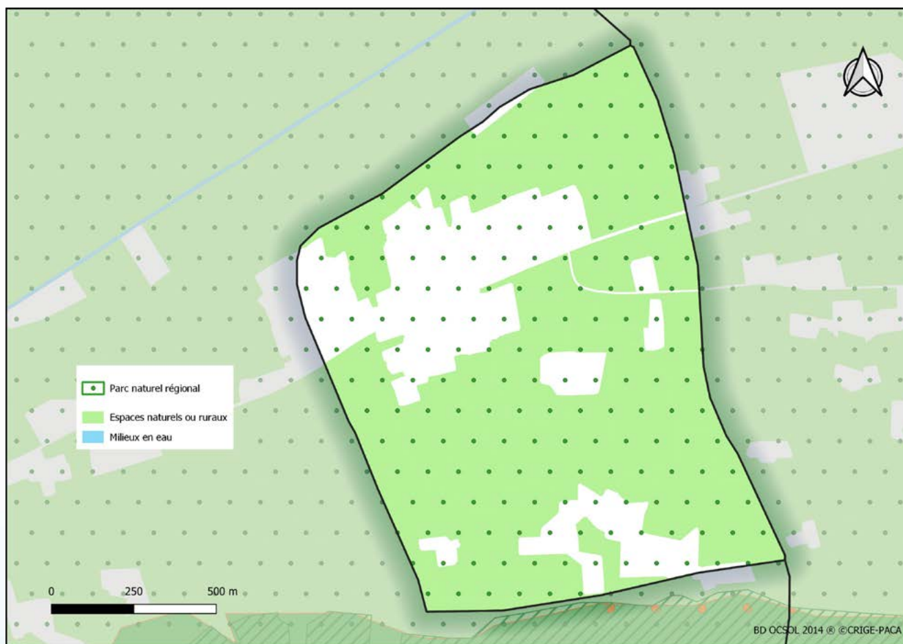
Carte 1 : Cartographie des espaces naturels de Mas-Blanc-des-Alpilles

D'une superficie de 2 km 2 dont 100 % sont identifiés par des zonages à enjeu écologique, la commune de Mas-Blanc-des-Alpilles est composée à 73 % d'espaces naturels et ruraux.