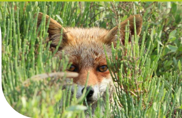
Renard roux