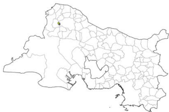
Localisation de la commune dans le département des Bouches-du-Rhône