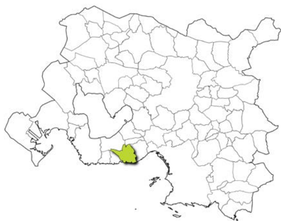
Localisation de la commune dans la métropole d'Aix-Marseille-Provence