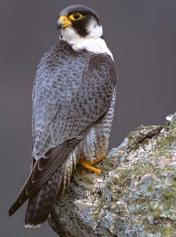
Faucon pèlerin