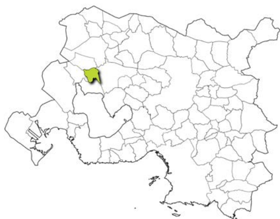
Localisation de la commune dans la métropole d'Aix-Marseille-Provence