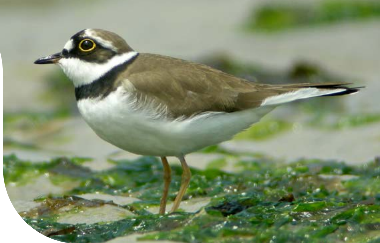
Petit gravelot