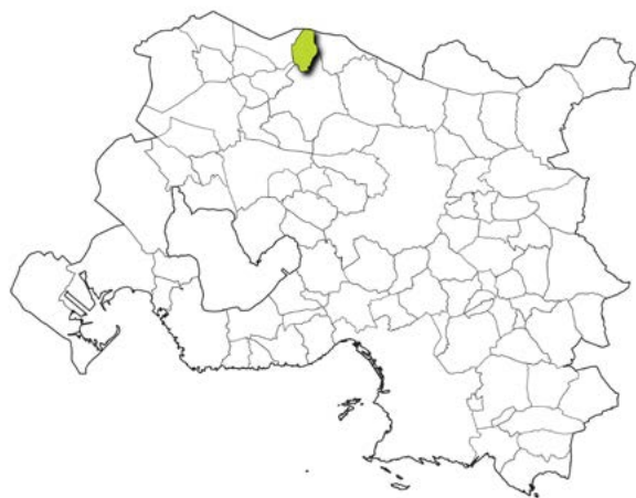
Localisation de la commune dans la métropole d'Aix-Marseille-Provence